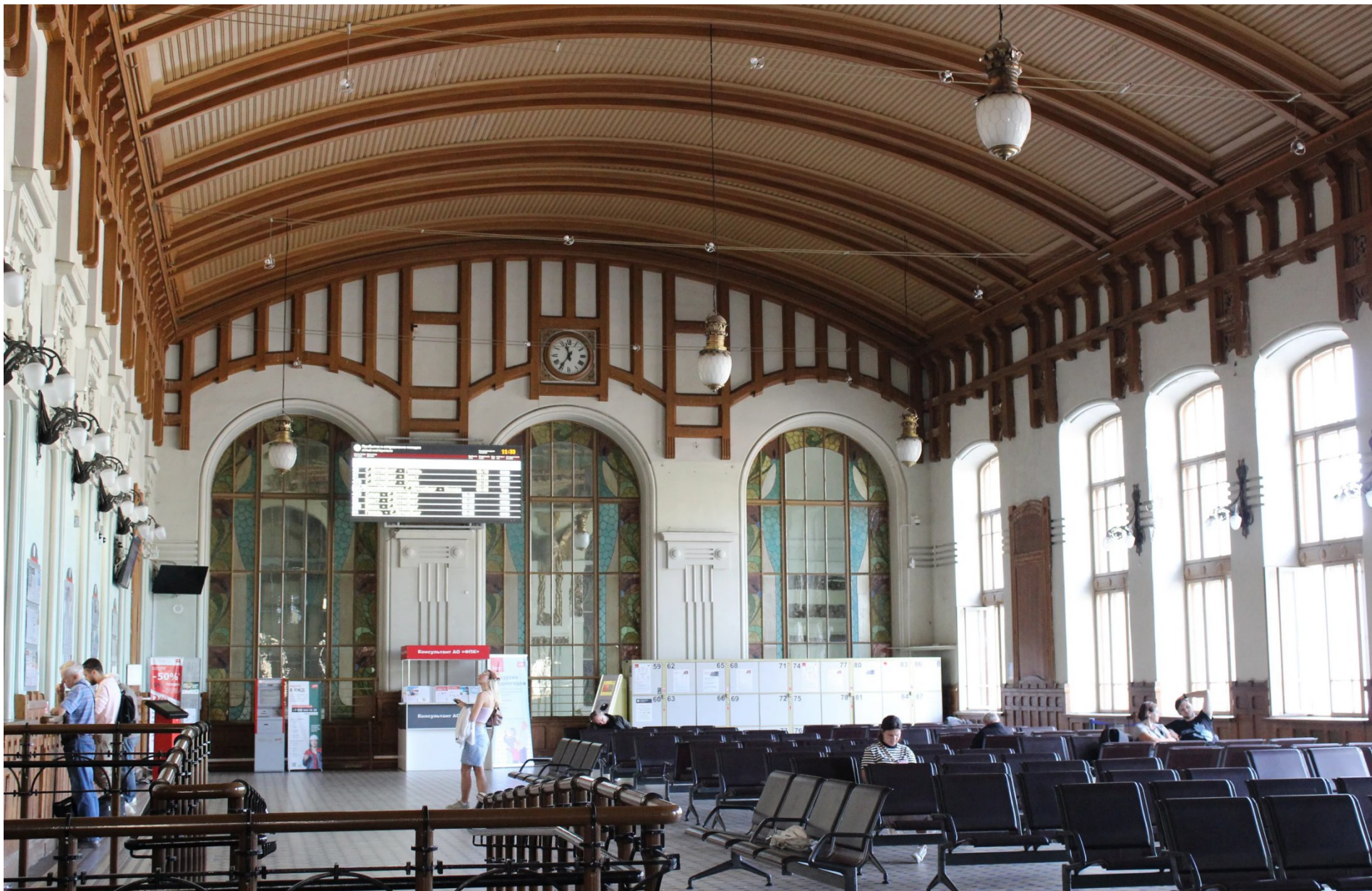
Перрон Витебского вокзала г. Санкт-Петербург