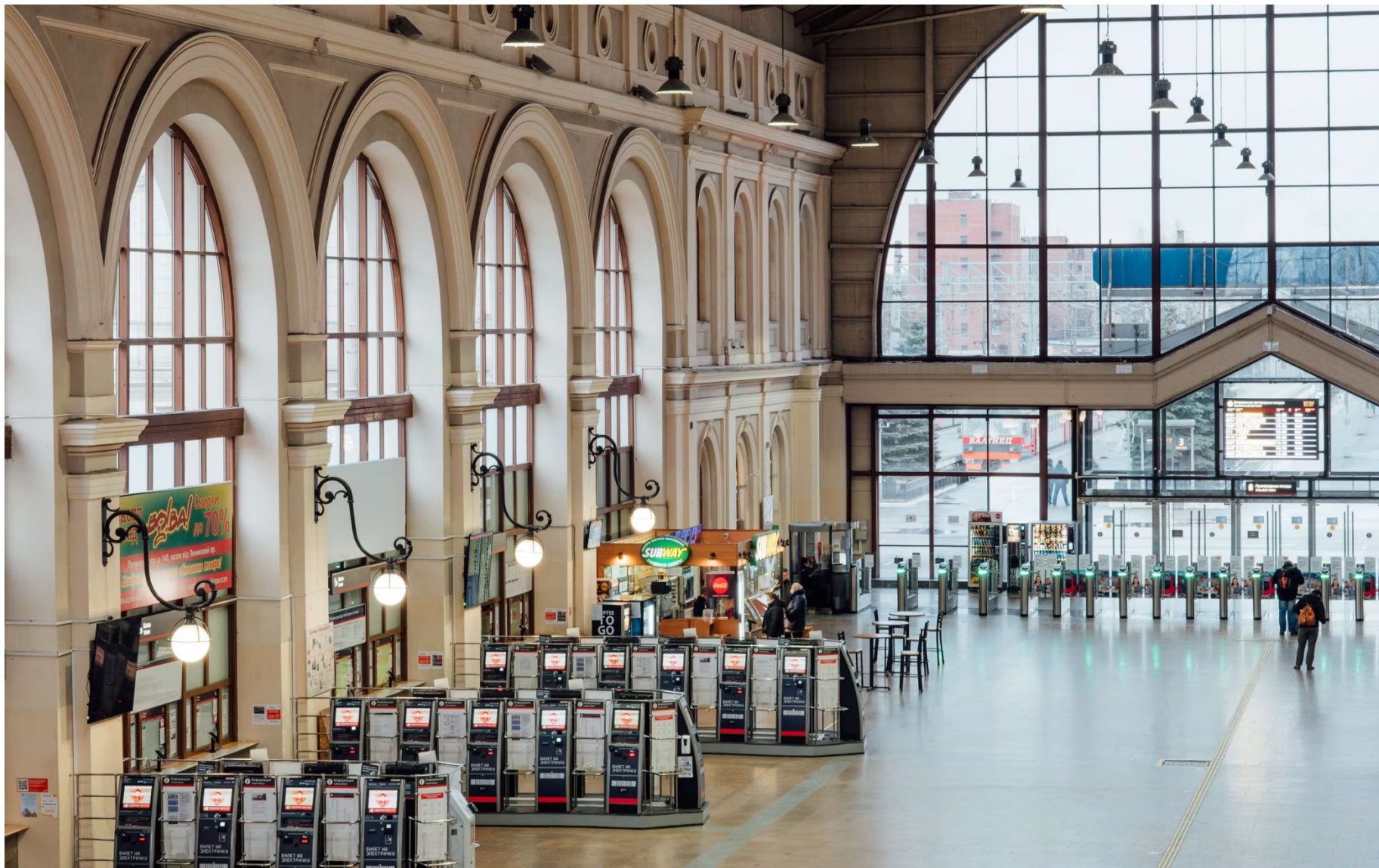
Здание Витебского вокзала г. Санкт-Петербург